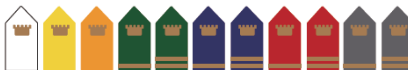
11級廚務徽章培育發展制度

新進同仁到職後，即實施新人訓練，並陸續舉辦各項教育訓練課程，除加強其專業素養外，同時宣導瓦城內部管理制度及經營理念。另因應餐飲業特性，我們為服務同仁及廚師同仁依職級需求而分類，設計多元化的學習課程，2020年總訓練時數，共計74,725小時。