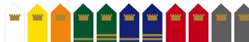
獨創11級培育發展制度